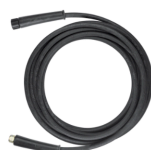
TUBO ARMATO ALTA PRESSIONE 3160590